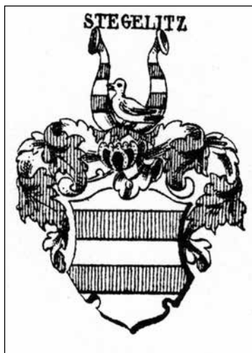
Ryc. 1. Herb rodu Steg(e)litz (wg Mülverstedt 1880, 90, tab. 54)